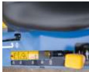
Réglage hauteur de coupe.

LE MODÈLE SRA600 EST SPÉCIALEMENT ÉTUDIÉ ET CONÇU POUR TRAVAILLER DANS LES RANGS ÉTROITS DES VIGNOBLES ET DES SAPINIÈRES