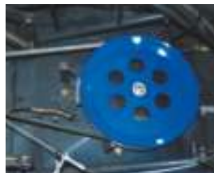
Transmission de lame par courroie avec poulie à ailettes.