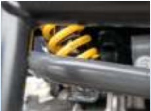
Suspensions sur l'essieu avant.

LES 2 MODÈLES SRA950A ET SRA950FA SONT ÉQUIPÉS DU PUISSANT BICYLINDRE KAWASAKI FS691V DE 726 CM³