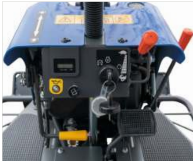
Des commandes facilement accessibles sur le tableau de bord.