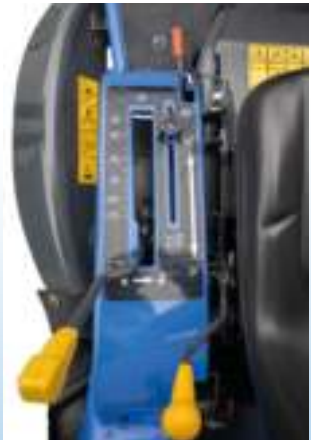
Réglage hauteur de coupe à 10 positions.